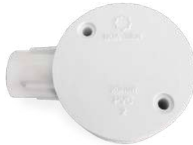
Hộp chia ngã PVC-U junction box