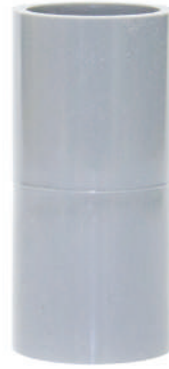
Nối tron PVC-U PVC-U Reducing Socket