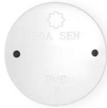
Nắp đậy PVC-U Junction Box Lid